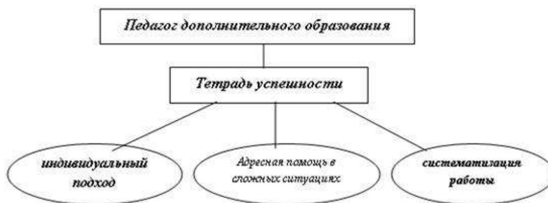
Рис. 1. Тетрадь успешности как форма фиксации достижений детей

Так, например, в «тетради успешности» отражаются успехи учащегося, полезные дела, которые он сделал для себя, своих родных, друзей и окружающих людей. Использование данной тетради позволяет повысить качество и результативность работы педагогов дополнительного образования (рис.1).